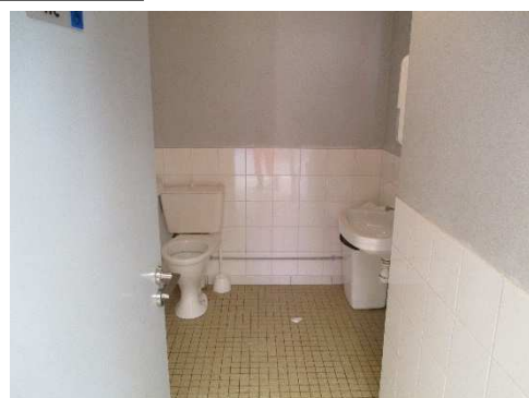
Hall salle des sports côté bar et côté vestiaire